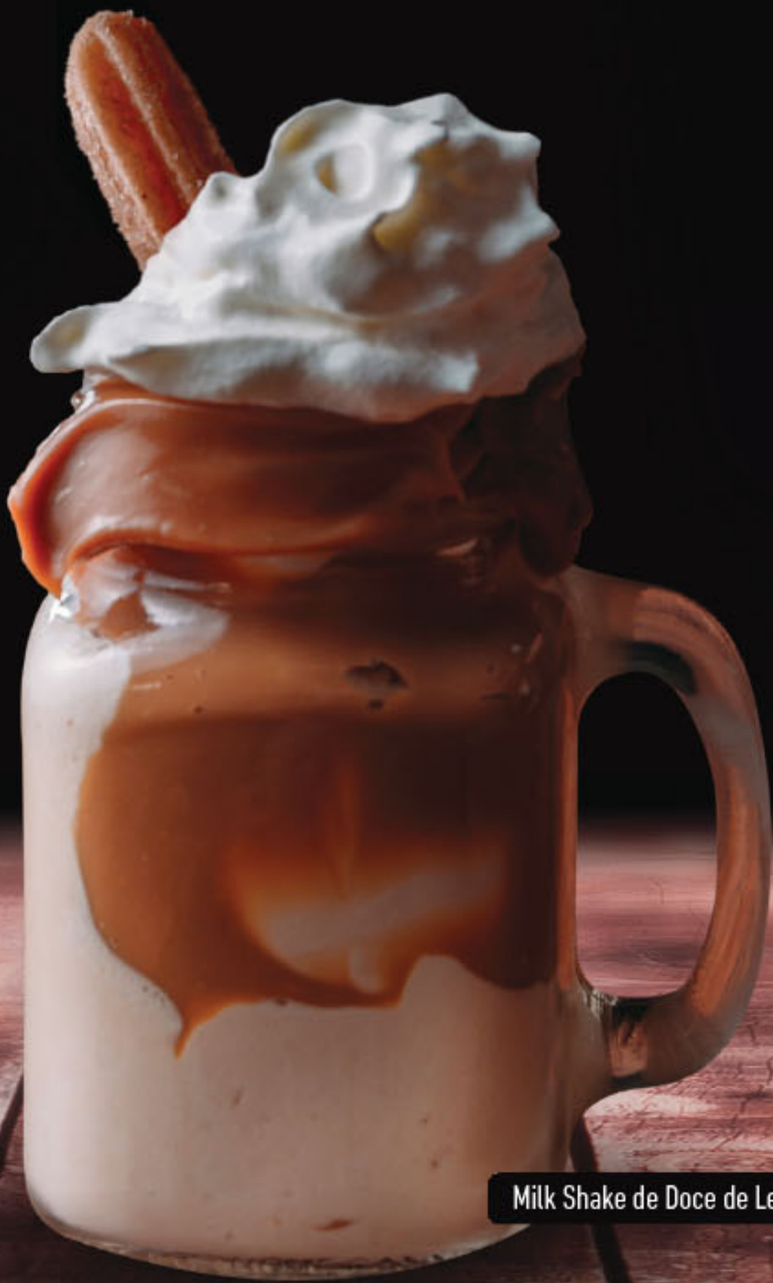
Milk Shake de Doce de Leite