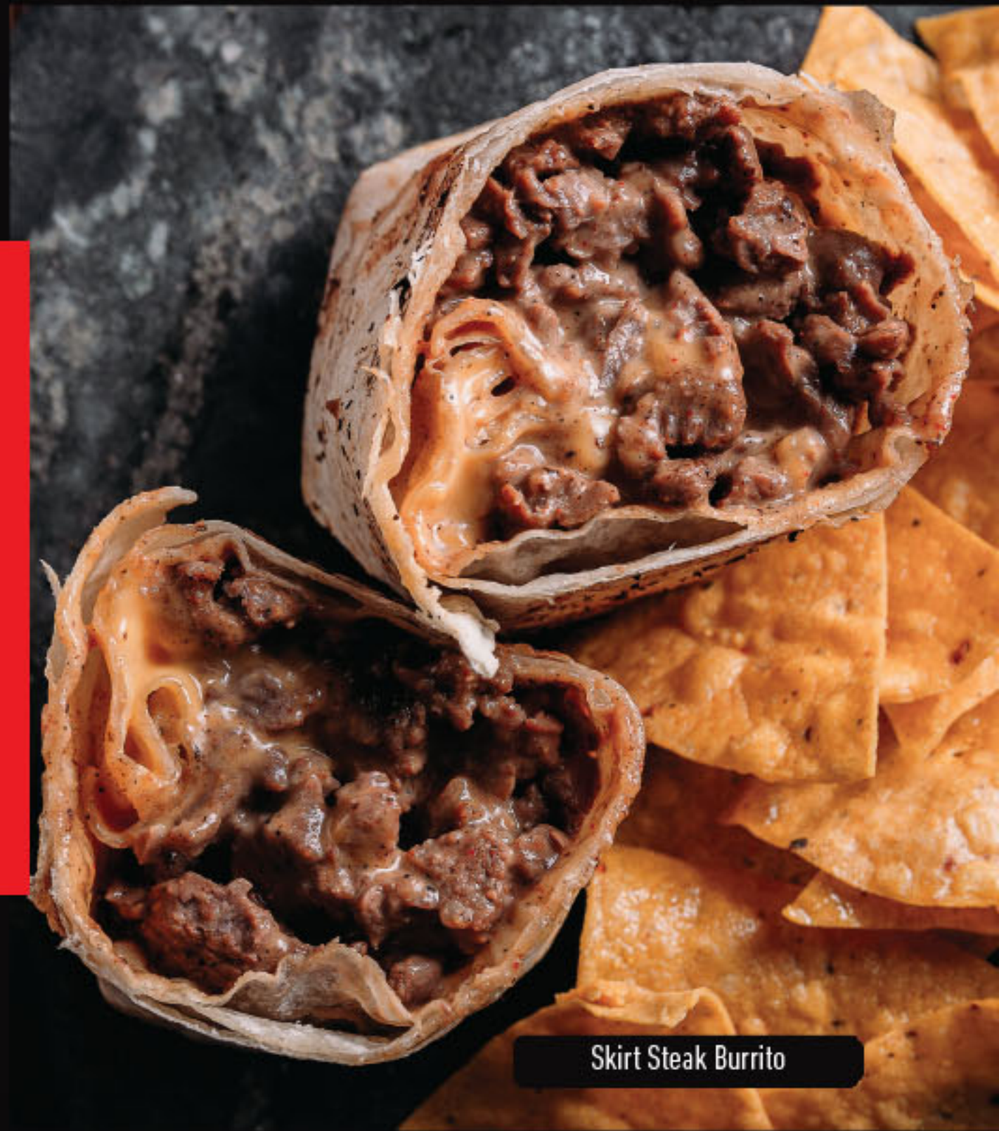
Skirt Steak Burrito

Tortilla de trigo recheada com a nossa premiada costelinha suína desfiada e regada ao molho barbecue, cebola em cubos, mix de queijos e mix de folhas. R$ 50,90