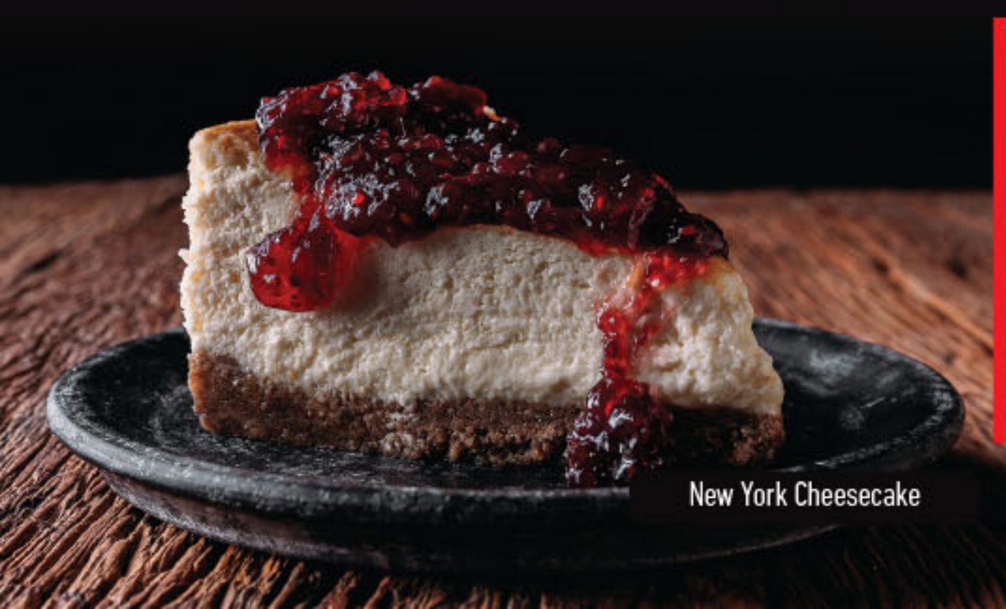
New York Cheesecake