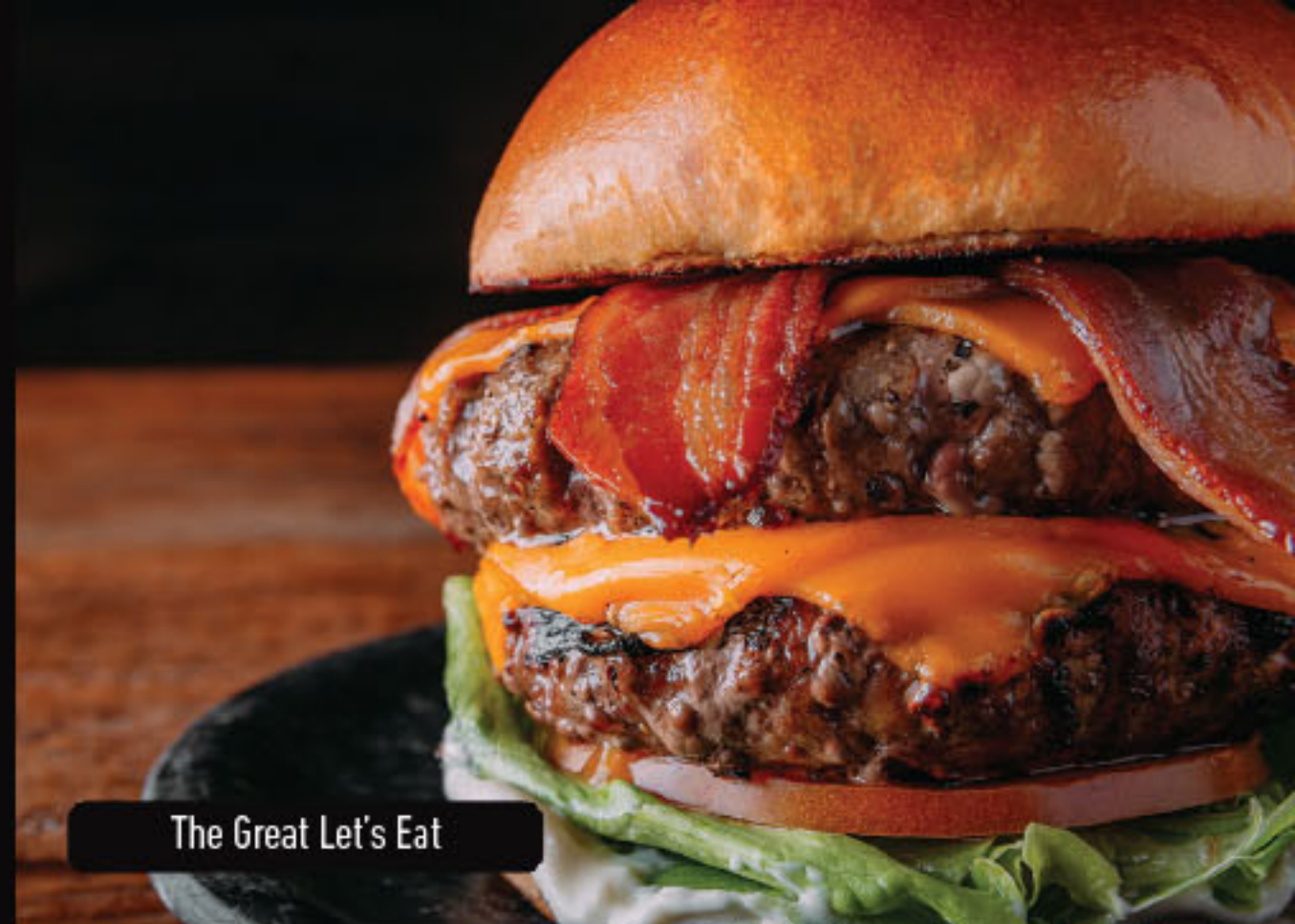
The Great Let's Eat

YUMMY! Hambúrguer Angus, mussarela empanada e crocante, sweet chilli de goiaba e rúcula. R$ 48,90