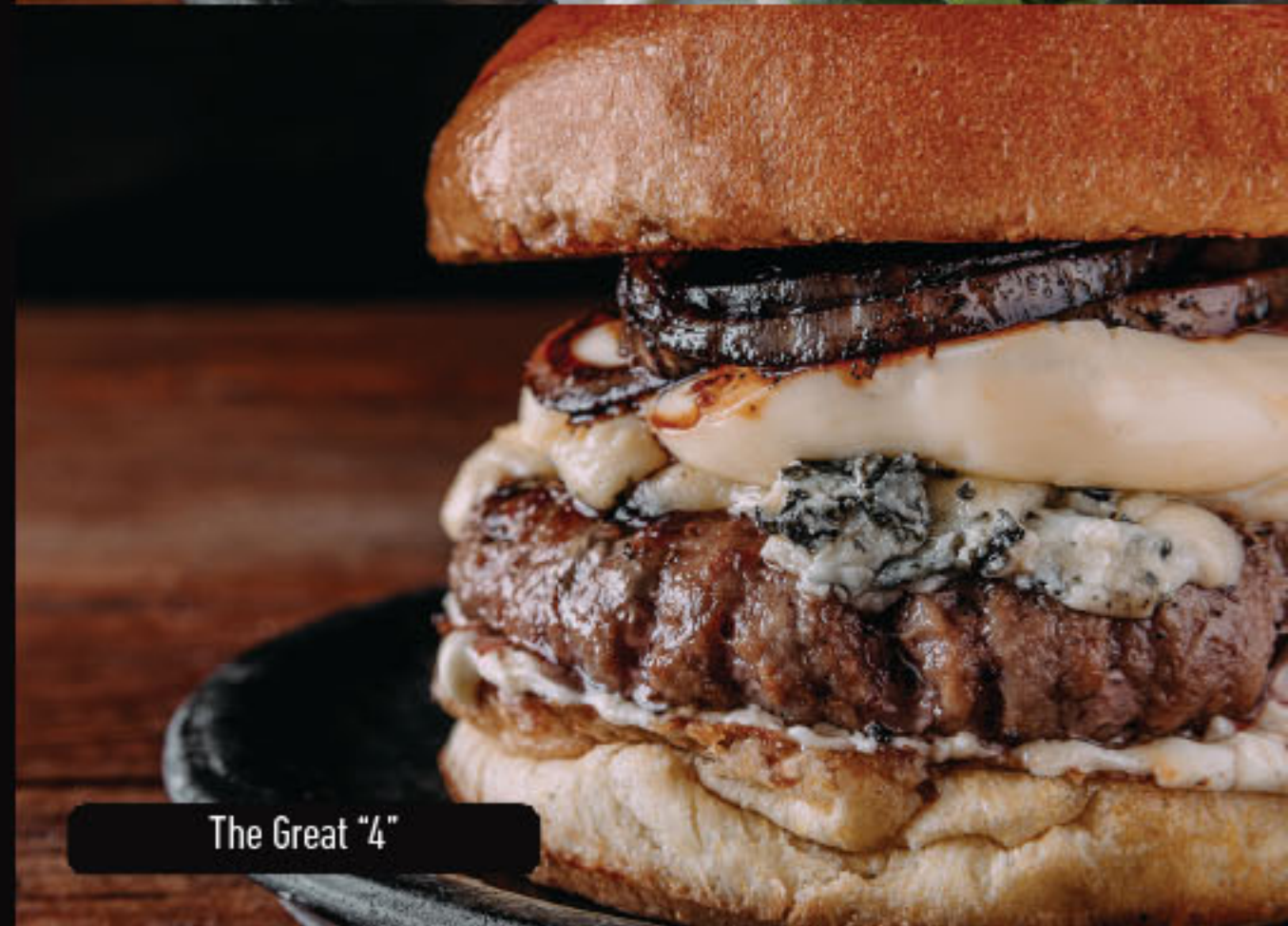
The Great "4"